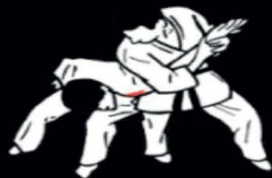
Nihon Tai Jitsu